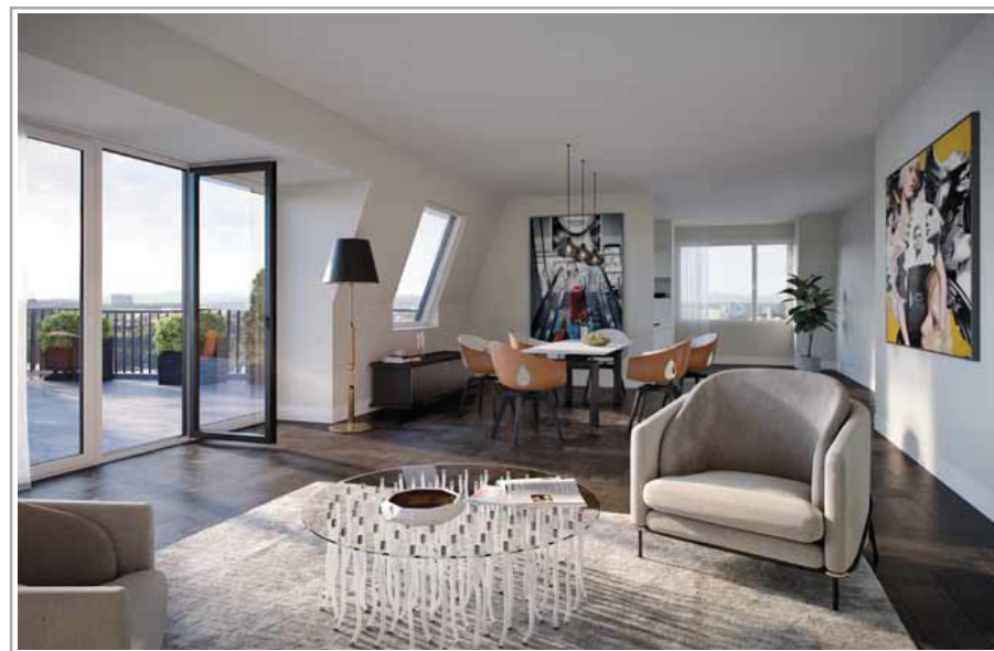
Penthouse 69, Interiors

Die Penthouse-Wohnungen wurden als „Projekt im Projekt“ konzipiert und besitzen ein eigenständiges Logo, das den Luxus-Wohnungen noch eine eigene Identität im Gebäude verleiht. Alle Materialien der Ausstattung sind auf das Edelste aufeinander abgestimmt. Sie wurden von Designern solange miteinander verglichen und bewertet, bis man sicher