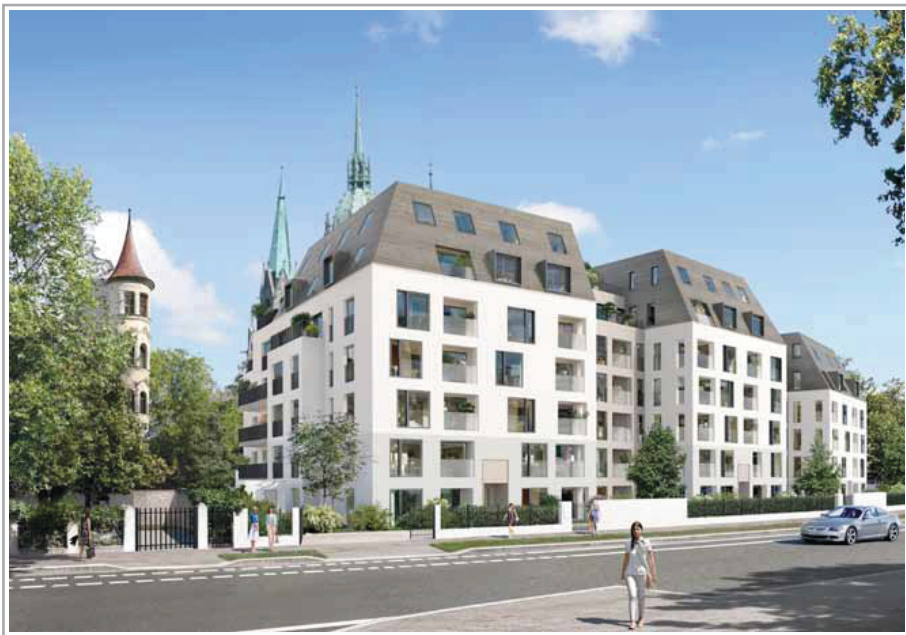
Das Bavaria Palais

Einmaligkeit erleben: Lage, Architektur, Interieur und Ausblick