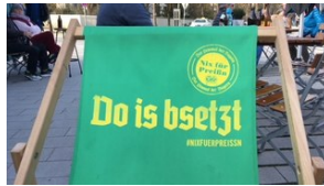
Werbekampagne Wie eine Münchner Brauerei sich über die Preißn lustig macht