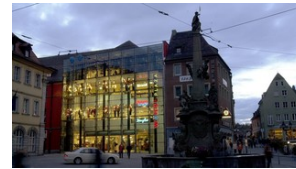
Polizei Mann rast mit Laster durch Würzburger Innenstadt und verletzt vier Menschen