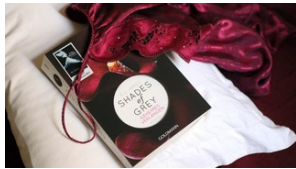
Lagerhalle zweckentfremdet Polizei beendet Sadomaso-Party